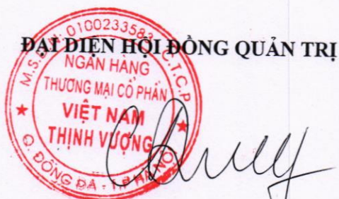
Ông Ngô Chí Dũng Chủ tịch Hội đồng Quản trị